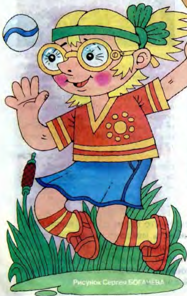
Рисунок Сергея БОГАЧЕВА