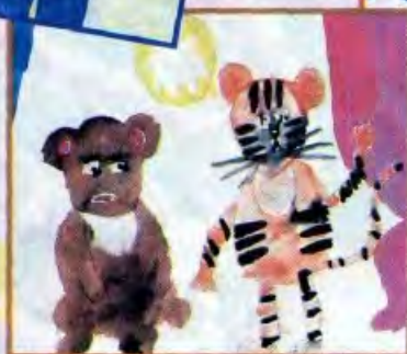
Люда МАКСИНА, Саратовская обл.