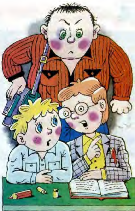
Рисунки Владимира УБОРЕВИЧА-БОРОВСКОГО