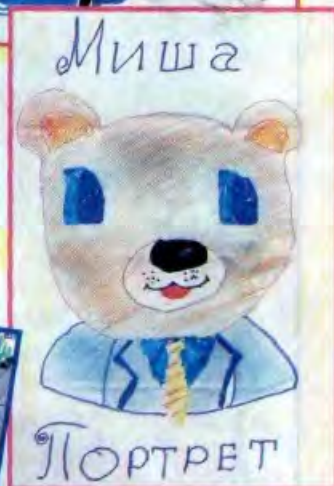
Света ИСАЕВА, Пензенская обл.