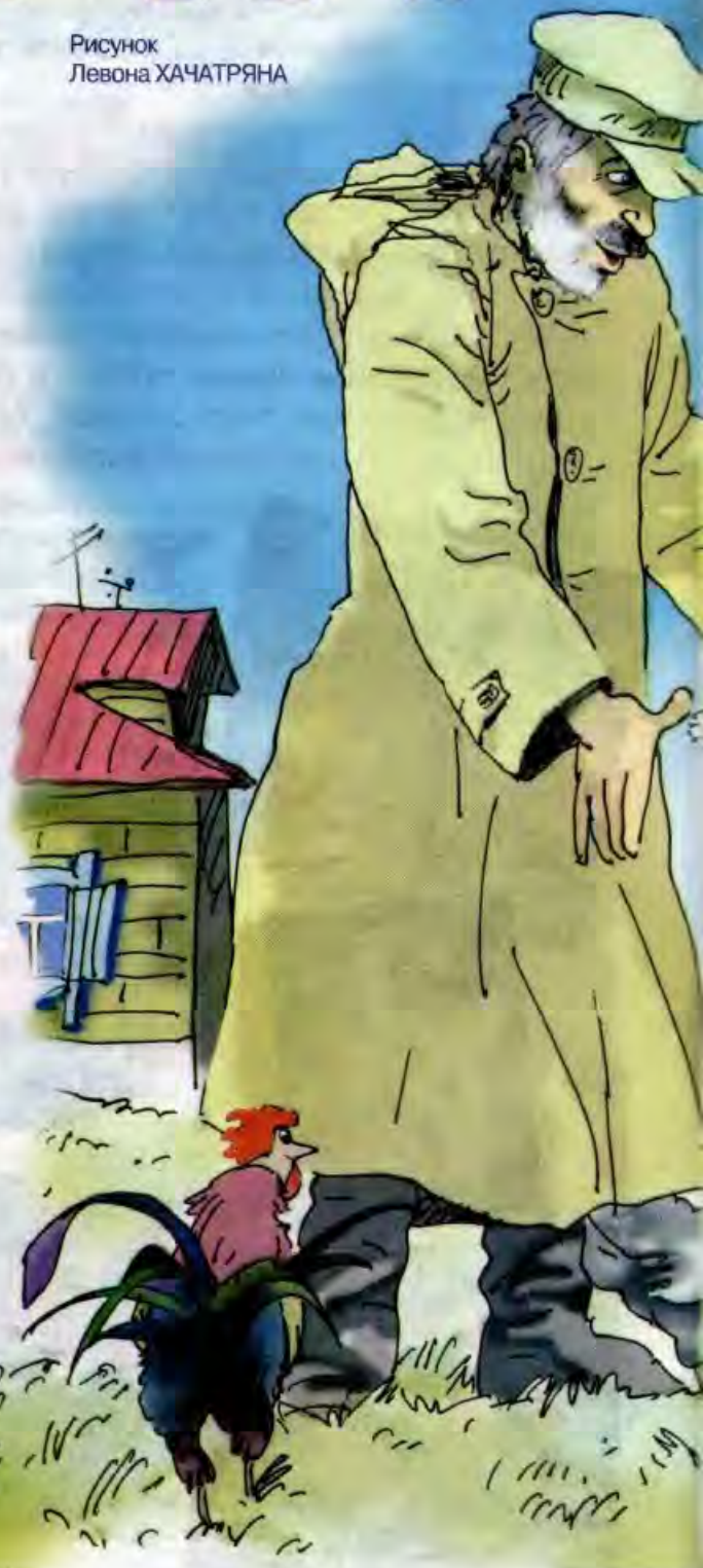
Рисунок Левона ХАЧАТРЯНА

С утра до вечера старик и его четвероногий друг были неразлучны. Вместе они затемно уходили со двора, вместе усталые возвращались домой. Пёс стал старику незаменимым