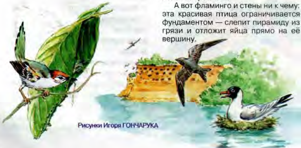
Рисунки Игоря ГОНЧАРУКА

А вот фламинго и стены ни к чему: эта красивая птица ограничивается фундаментом — слепит пирамиду из грязи и отложит яйца прямо на её вершину.