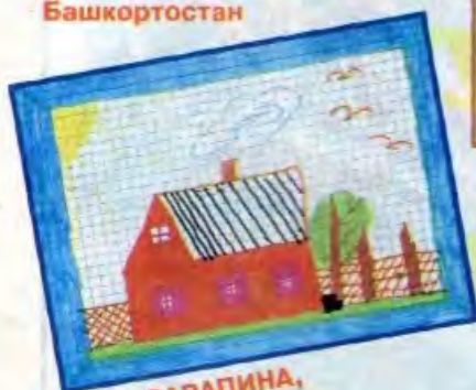
Женя САРАПИНА, г. Великие Луки