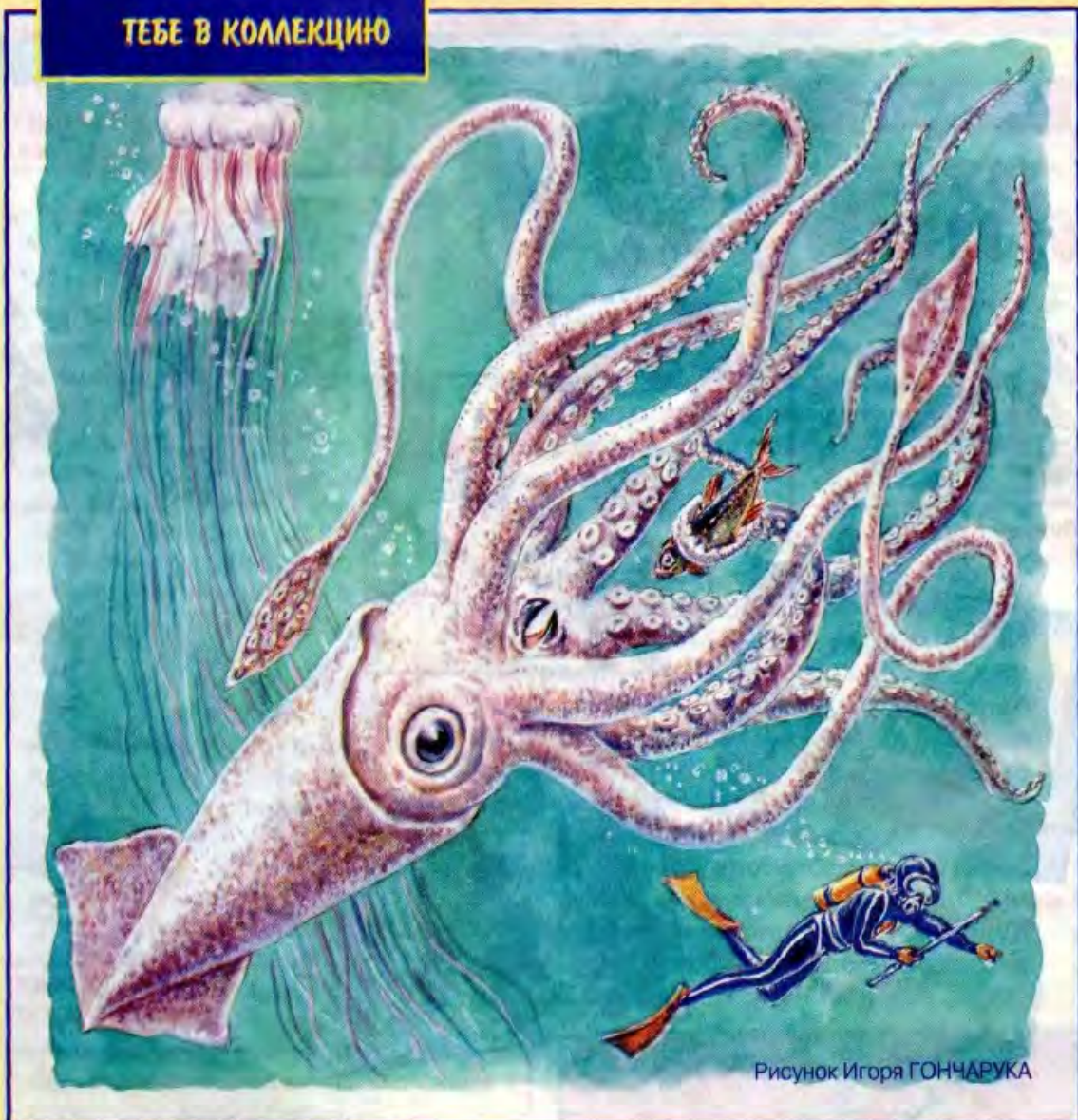
Рисунок Игоря ГОНЧАРУКА

Это огромное чудище 18-ти метров в длину – кальмар кракен, родственник того маленького кальмара, что ты, дружок, не раз видел в магазине.