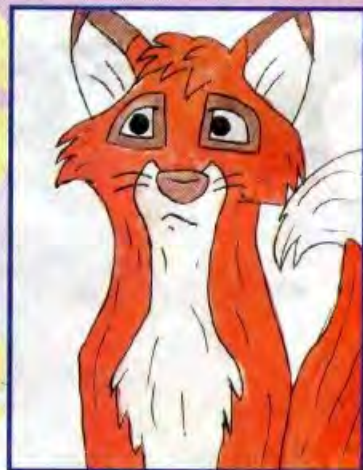
Аня ЯРЦЕВА, Пермская обл.