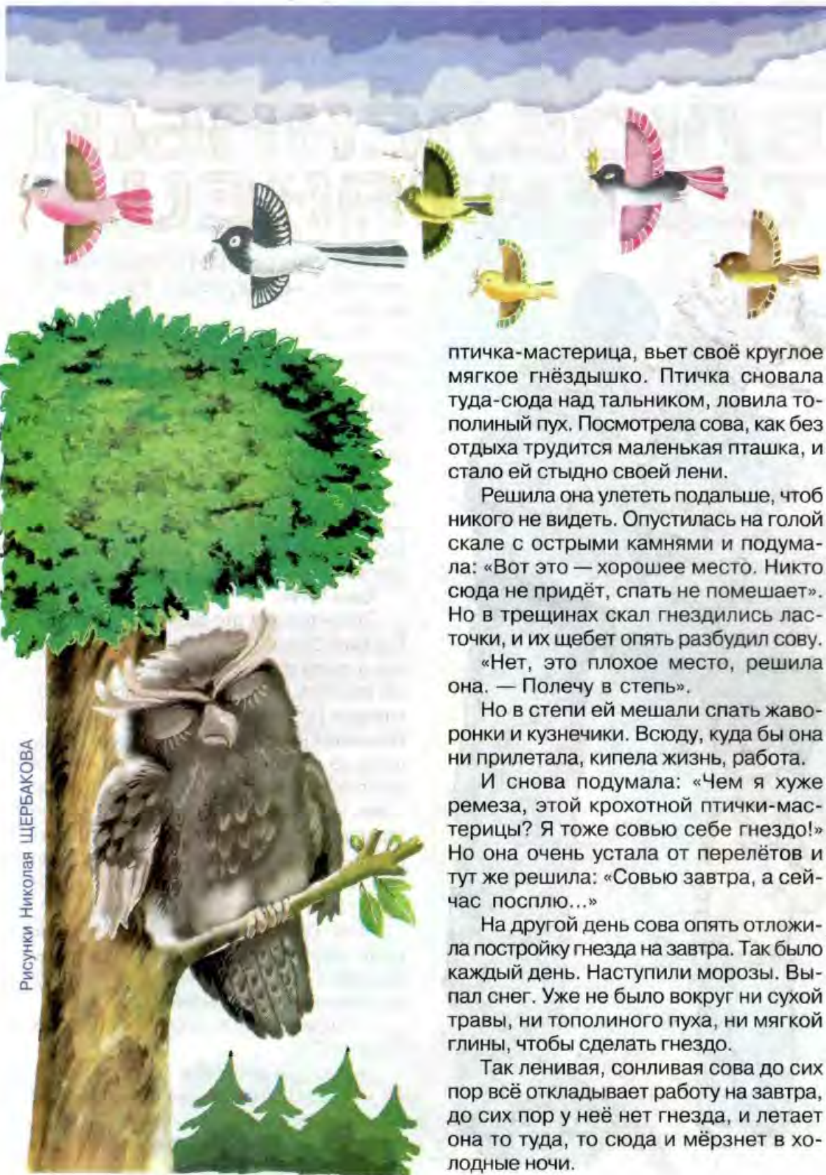
Рисунки Николая ЩЕРБАКОВА

птичка-мастерица, вьет своё круглое мягкое гнёздышко. Птичка сновала туда-сюда над тальником, ловила тополиный пух. Посмотрела сова, как без отдыха трудится маленькая пташка, и стало ей стыдно своей лени.