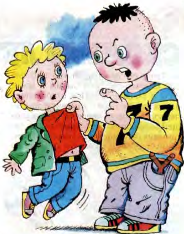
Рисунки Владимира УБОРЕВИЧА-БОРОВСКОГО

В конце концов, рано или поздно это должно было случиться.