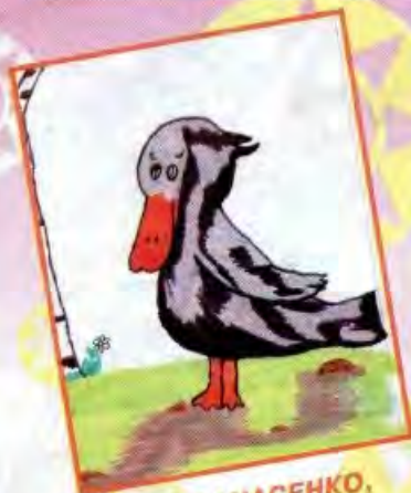
Вика АФАНАСЕНКО, Волгоградская обл.