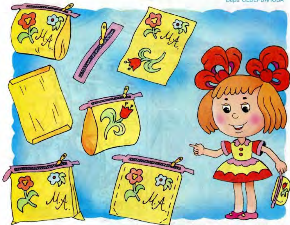
Рисунок Дмитрия КОЗУЛИНА