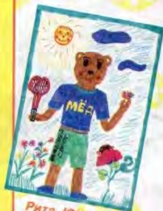
Рита ЮШКОВА, г. Гомель