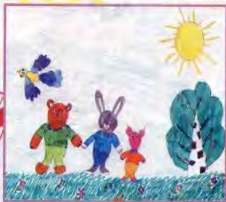
Даша НОВИКОВА, г. Тюмень