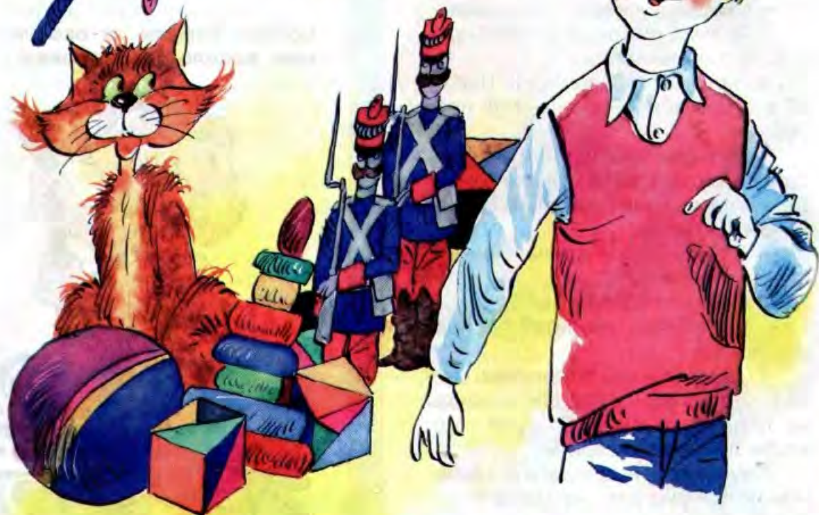
Рисунок Леоны ХАЧАТРЯНА

Маму за руку веду — Ей немного страшно. Мама, я не пропаду, Не грусти напрасно!