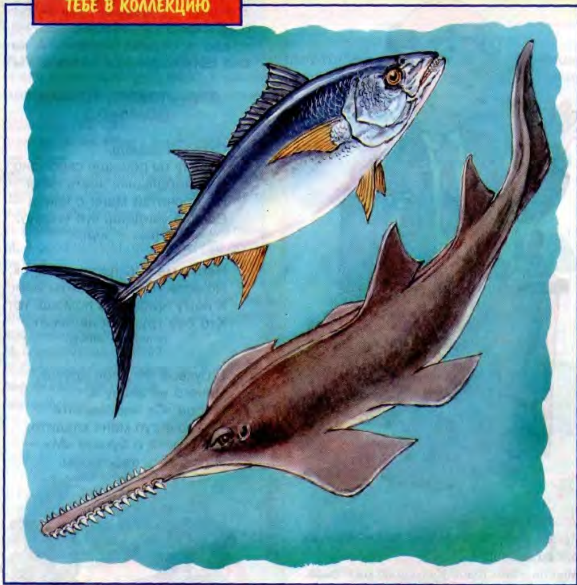
Рисунок Игоря ГОНЧАРУКА

Ничего себе «рыбёшки» приплыли на сей раз в твой домашний аквариум! Верхний «гость» — тунец — вырастает до 3 метров и порой весит до 300 килограммов. Тунец один из самых быстрых морских обитателей, и ещё это ценная промысловая рыба, её ловят и на удочку, и промышленным способом — с рыболовных судов.