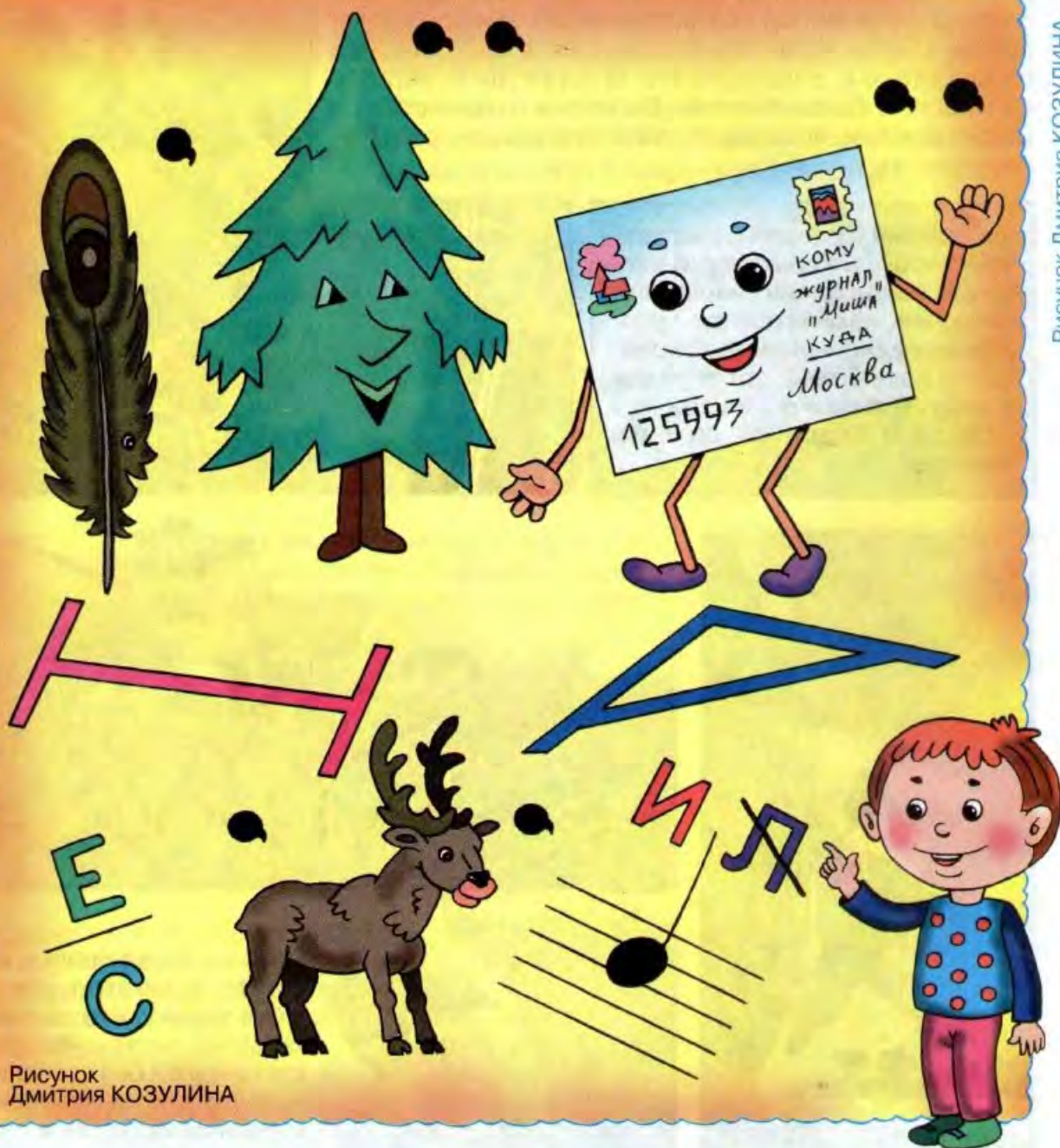
Рисунок Дмитрия КОЗУЛИНА

Дорогой друг! Мы дарим тебе этот занимательный ребус. Надеемся, родители помогут тебе его разгадать, и ты узнаешь, какое важнейшее мероприятие будет проводиться в нашей стране в ближайшее время.