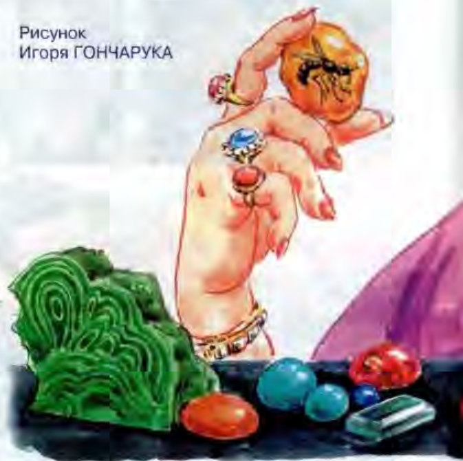
Рисунок Игоря ГОНЧАРУКА

алмазам так же, как и людям, дают имена, и с ними связано больше всего таинственных историй. Нередко люди убивали друг друга, чтобы завладеть драгоценными камнями. В Алмазном фонде России в Москве хранится знаменитый алмаз «Шах», который нашли более пяти веков назад в Индии. Тогда он был размером с картофелину и носил имя «Великий Могол». Первый его владелец был вскоре покорен могущественным Акбаром из рода Великих Моголов, а внук Акбара, чтобы получить этот дорогой камень, заточил в темницу родного отца. В XV или XVI веке его пытались обработать, но «Великий Могол» распался на два куска. Конечно, ювелиры-гранильщики были тут же