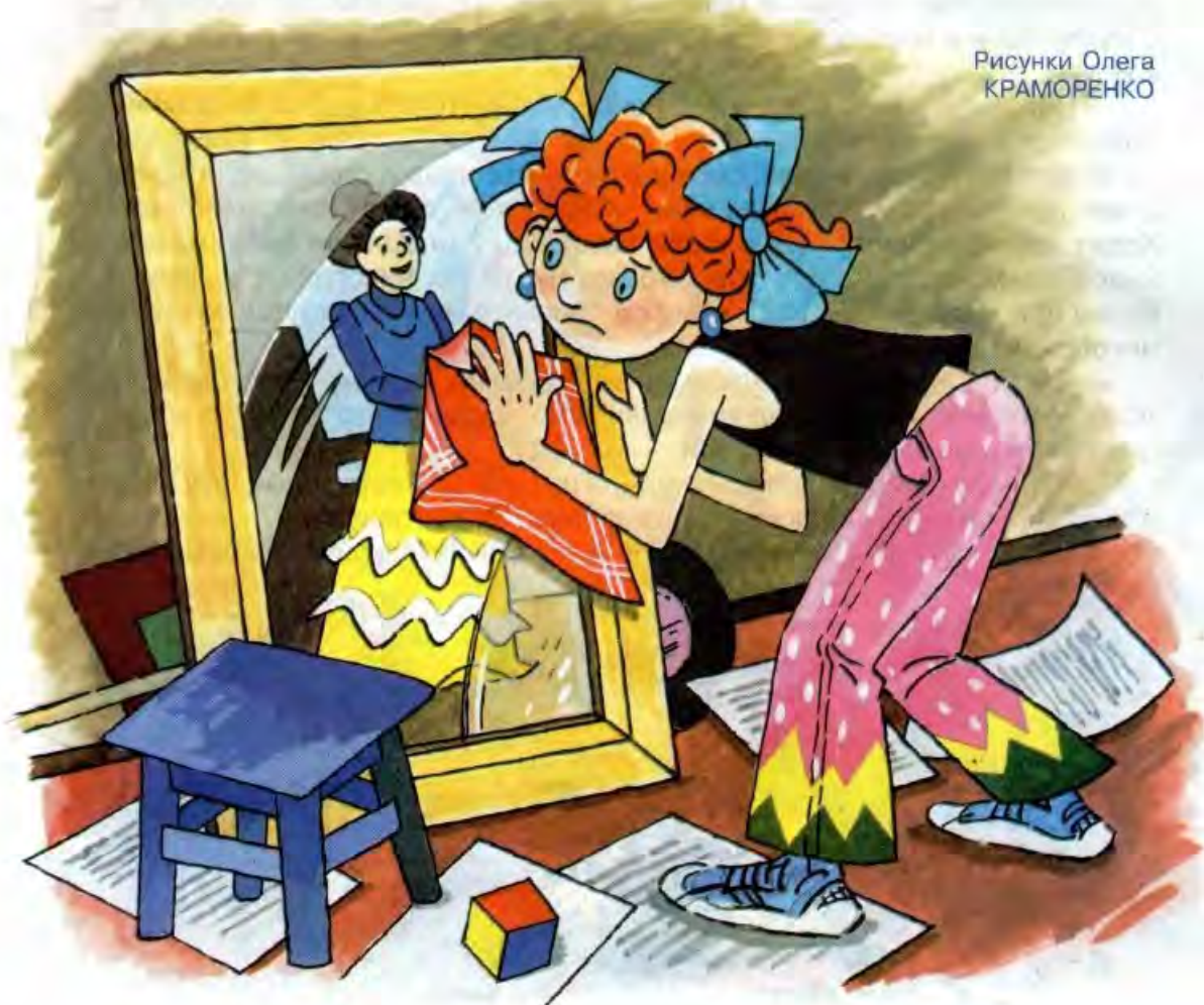
Рисунки Олега КРАМОРЕНКО

— Но он не обращает на меня никакого внимания, — тяжело вздохнув, ответила девочка.