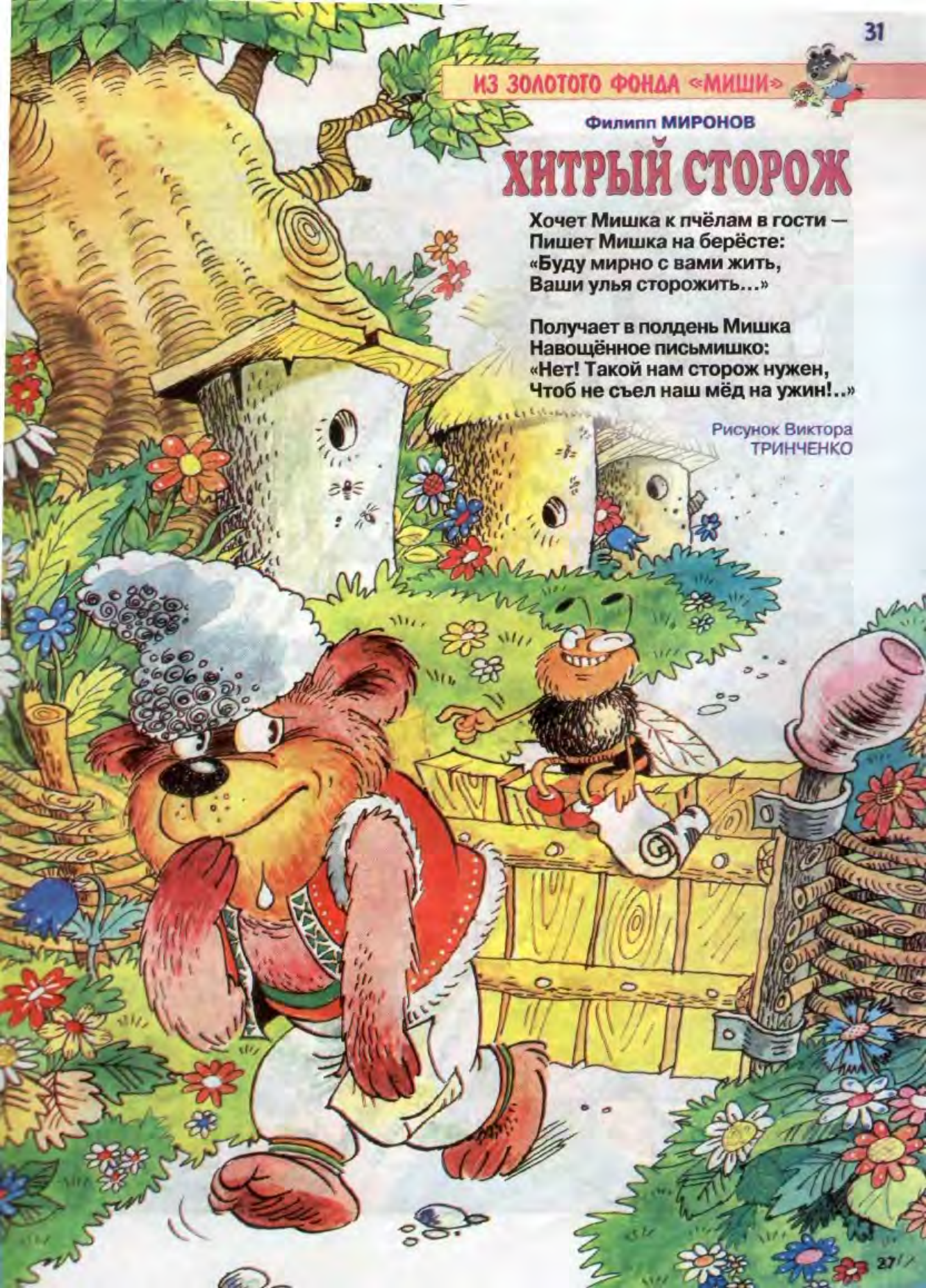
Рисунок Виктора ТРИНЧЕНКО

Получает в полдень Мишка Навощённое письмишко: «Нет! Такой нам сторож нужен, Чтоб не съел наш мёд на ужин!..»