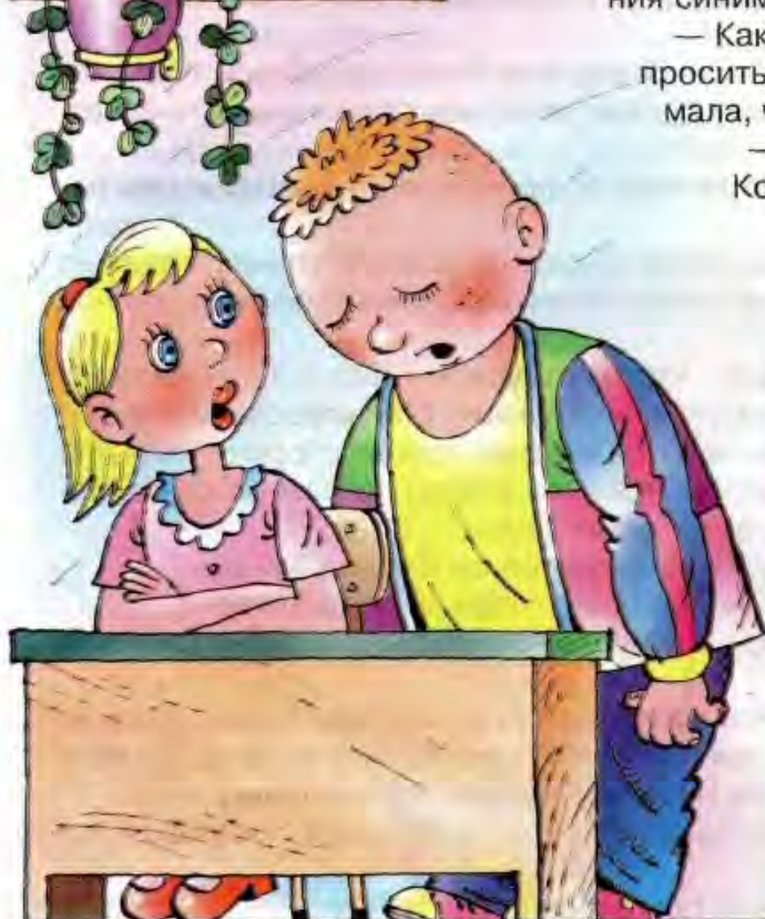
Рисунки Владимира УБОРЕВИЧА-БОРОВСКОГО