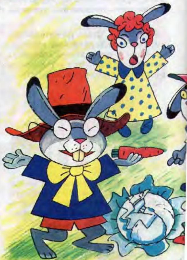
Рисунок Олега КРАМОПЕНКО

— Здравствуй, Мишенька! Мне зайцы рассказали, какие полезные сове-