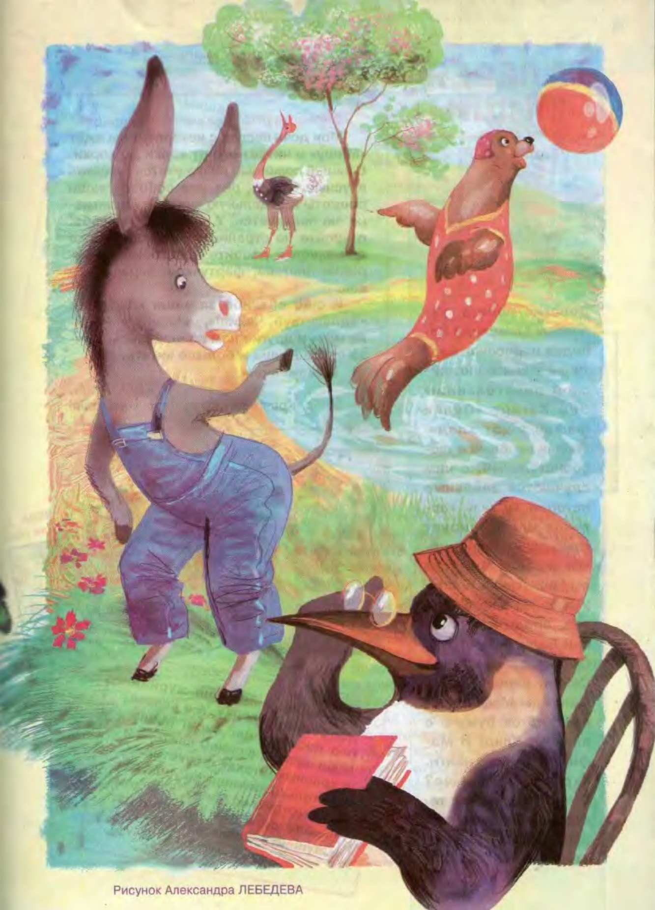
Рисунок Александра ЛЕБЕДЕВА