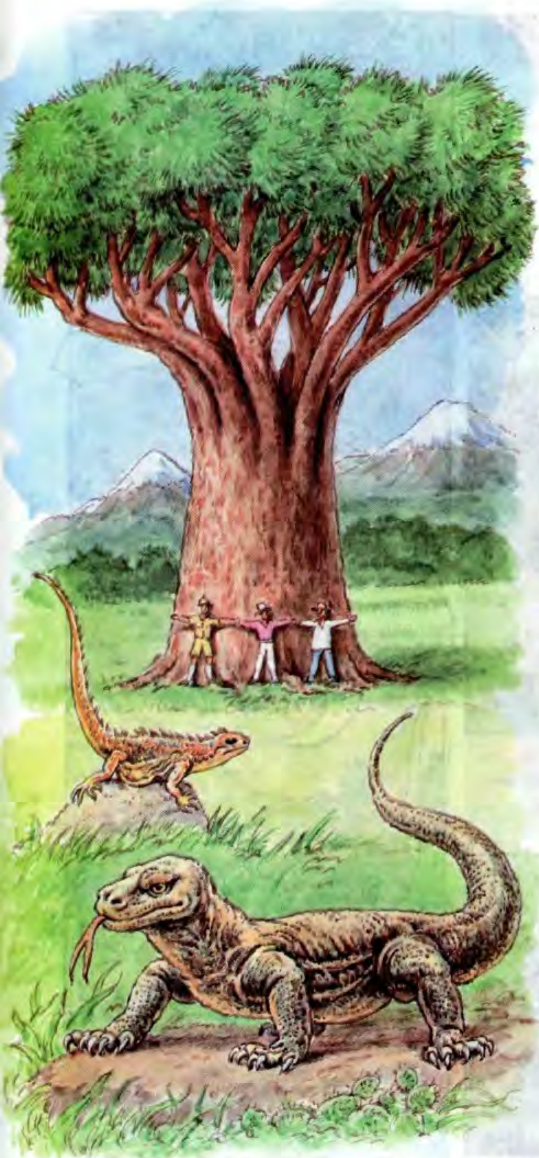
Рисунок Игоря ГОНЧАРУКА