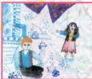
Лена ЗВЁЗДОЧКИНА, с. Печерники, Рязанской обл.