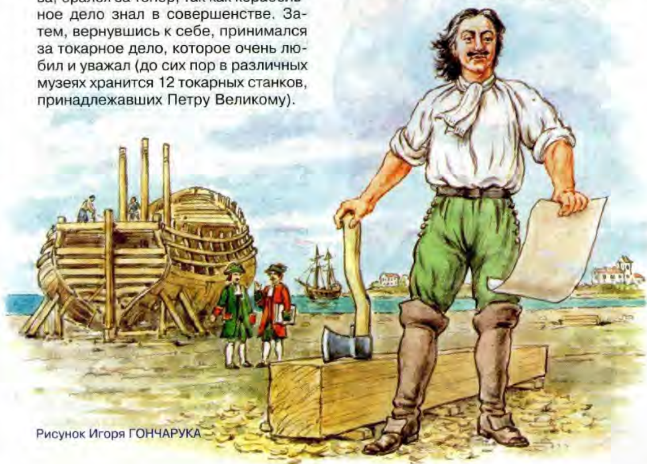
Рисунок Игоря ГОНЧАРУКА