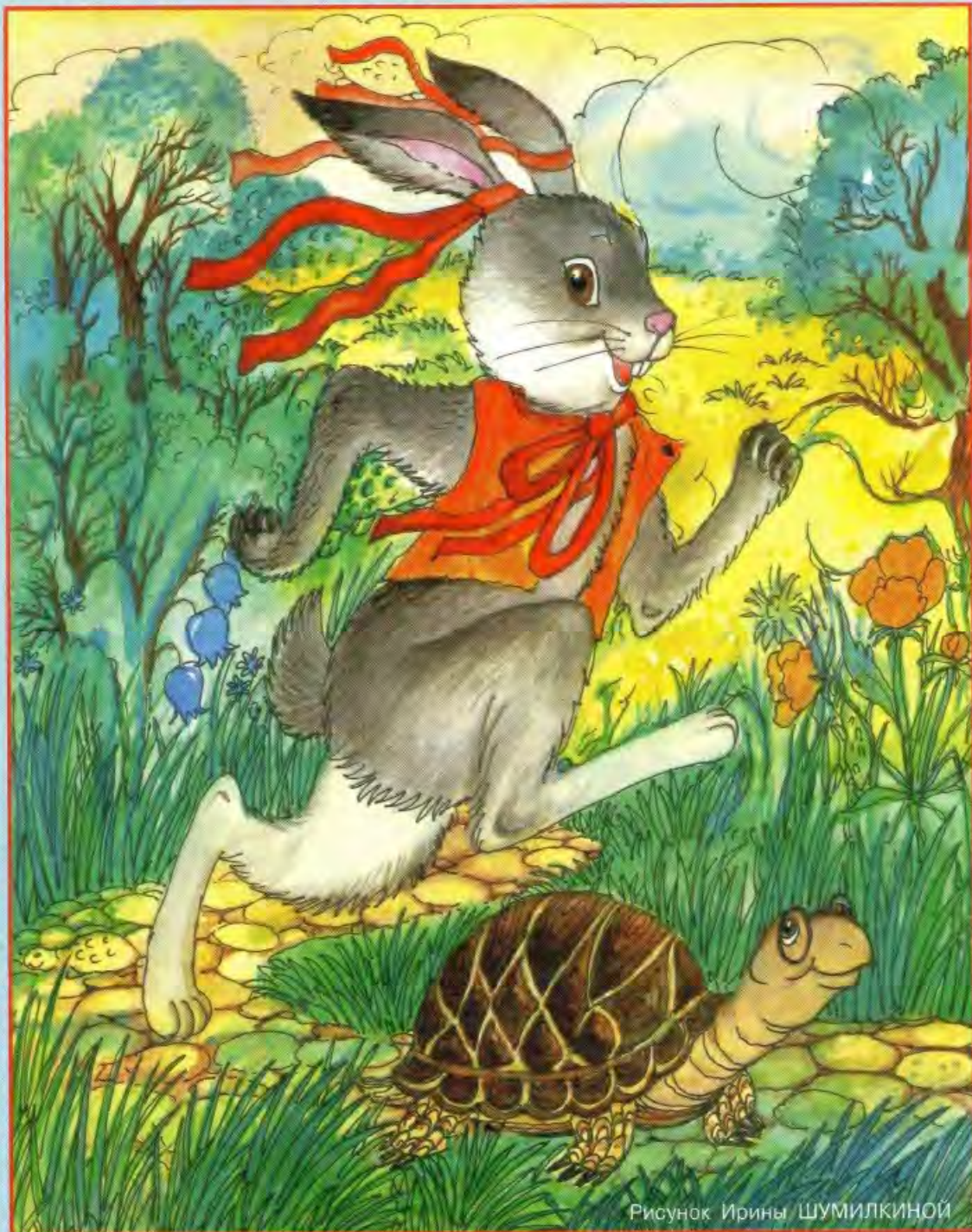
Рисунок Ирины ШУМИЛКИНОЙ

Найди на картинке кроме братца Кролика и братца Черепахи ещё пять черепах, братца Медведя, братца Лиса и братца Волка.