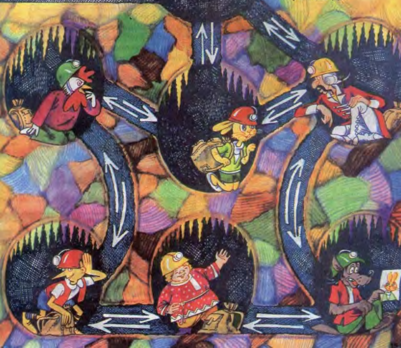
Рисунок Валентина РОЗАНЦЕВА

Сделайте 6 фишек и напишите на них имена наших героев. Положите фишки на картинку лицом вниз, перемешайте и закройте ими пещеры. Затем переверните фишки и двигайте их из пещеры в пещеру по направлению стрелок, пока не вернёте всех на прежние места. Но помните: лазы между пещерами узкие, двигаться по ним можно только по одному, в пещерах тоже места мало — на одного, а чтобы разминуться, заводите героев по очереди в свободную пещеру.