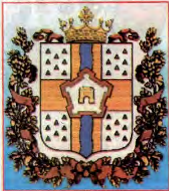
Герб Омской области