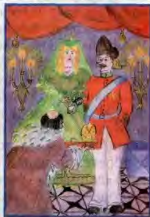
«Синяя свечка». Маша РОЧЕВА, д. Бахур, Рес- публика Коми.