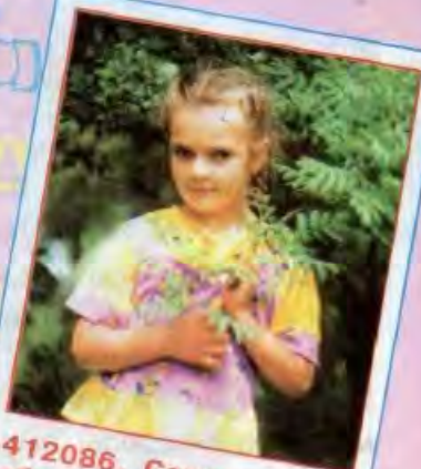
412086, Саратовская обл., Турковский р-н, с. Чернавка, ул. Сапатовая, д. 25 ТАНЕ

Учусь в музыкальной школе, люблю моделировать. 169575 Республика Коми, Вуктыльский р-н, с. Дугово, ул. Молодежная, д. 21 ЕРЕМИНОЙ Юле