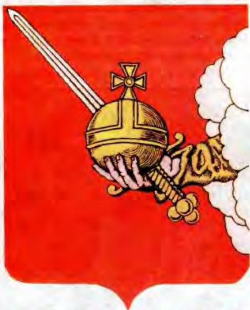
Герб Вологодской области

выми (справа) и кедровыми (слева) ветками, перевитыми голубой лентой. На гербе изображены ленты орденов, которыми награждён край, лев символизирует власть, отвагу, храбрость и великодушие, лопата и серп — плодородие и богатство недр, светло-