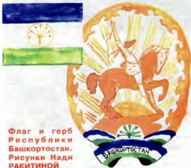
Флаг и герб Республики Башкортостан. Рисунки Нади РАКИТИНОЙ

Не хватит журнальных страниц, чтобы описать все присланные гербы и флаги! Каждый гражданин России должен знать свою государственную символику. Мы рады что читатели «Миши» гордятся своей Родиной и отлично справились с этим заданием.