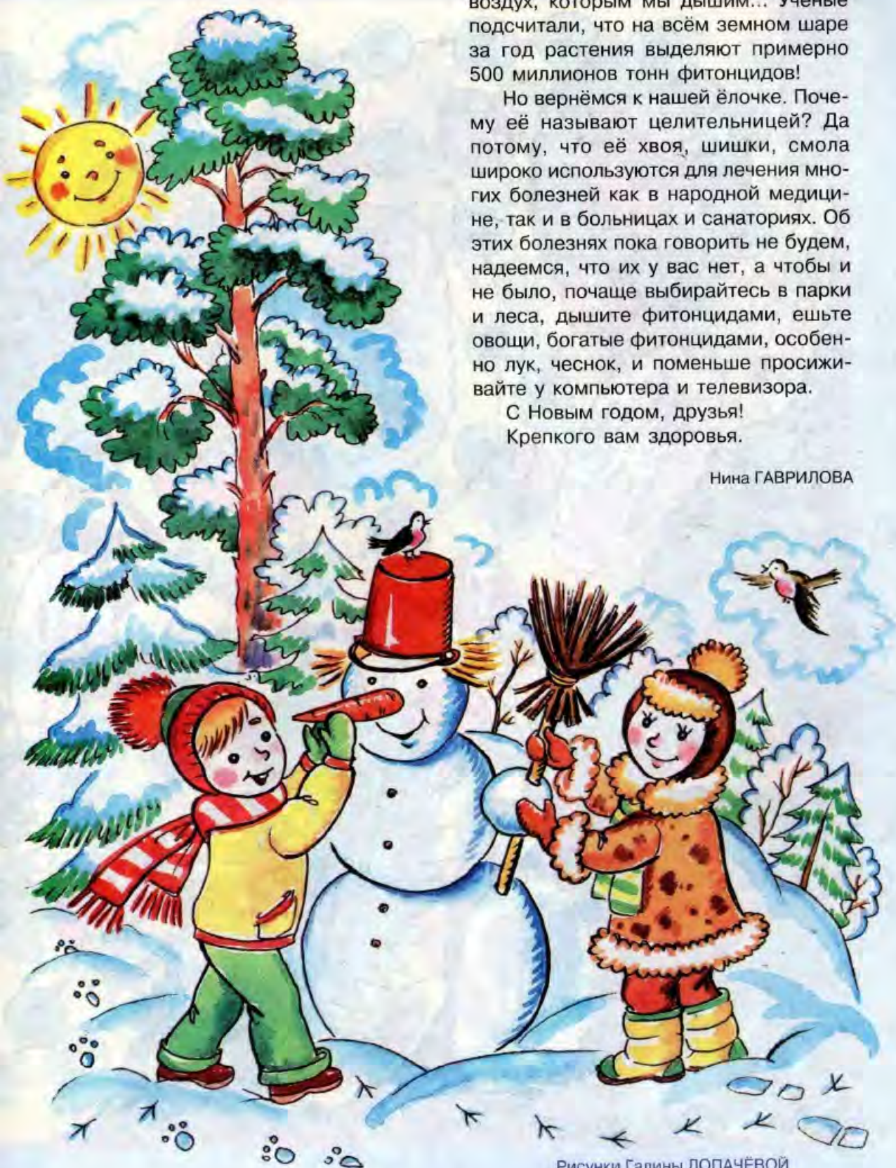
Рисунки Галины ЛОПАЧЁВОЙ