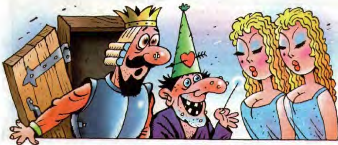
Рисунки Владимира УБОРЕВИЧА-БОРОВСКОГО

И знаменитый путешественник, закурив свою знаменитую трубочку, потопал по шпалам домой — в двадцать первый век. Есть свой любимый пудинг.