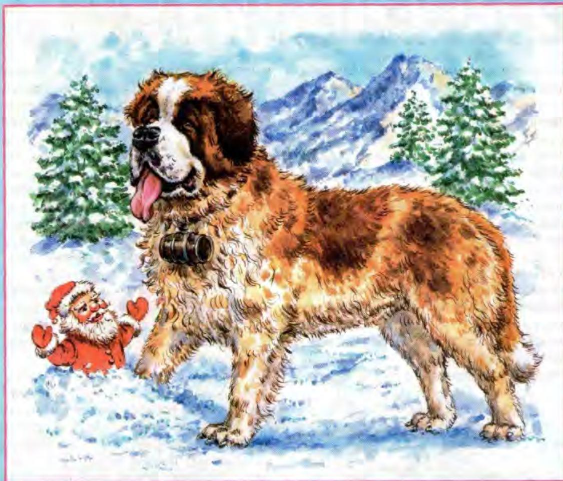
Рисунок Игоря ГОНЧАРУКА

Наш художник, конечно, пошутил. Дед Мороз никогда не замёрзнет в горах, и помощь сенбернара ему там не потребуется. А вот обычным путешественникам эти огромные лохматые собаки не раз спасали жизнь. Впервые стали готовить собак-спасателей в монастыре Святого Бернара в Швейцарских Альпах. Дело в том, что погода в горах ненадёжная: то светит солнце, а то вдруг начинает валить снег, принимаются сползать с вершин снежные лавины. Неосторожный путник легко может сбиться с пути и оказаться под толстым слоем снега. Вот тогда-то монахи и выпускали псов на поиски заблудившихся и замерзающих странников. К шее у каждого лохматого спасателя был привязан бочонок с коньяком, чтобы человек мог согреться и выбраться из-под снега.