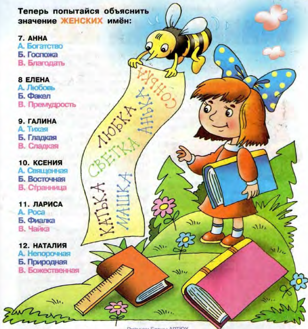
Рисунки Елены АРТИУХ

Для желающих проверить свои знания приводим правильные ответы: 1Б; 2В; 3А; 4В; 5Б; 6В; 7 В; 8Б; 9А; 10В; 11В; 12Б.