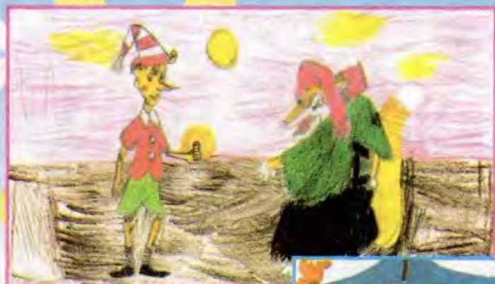
Катя ТРИФОНОВА, с. Красный Рог, Брянской обл.