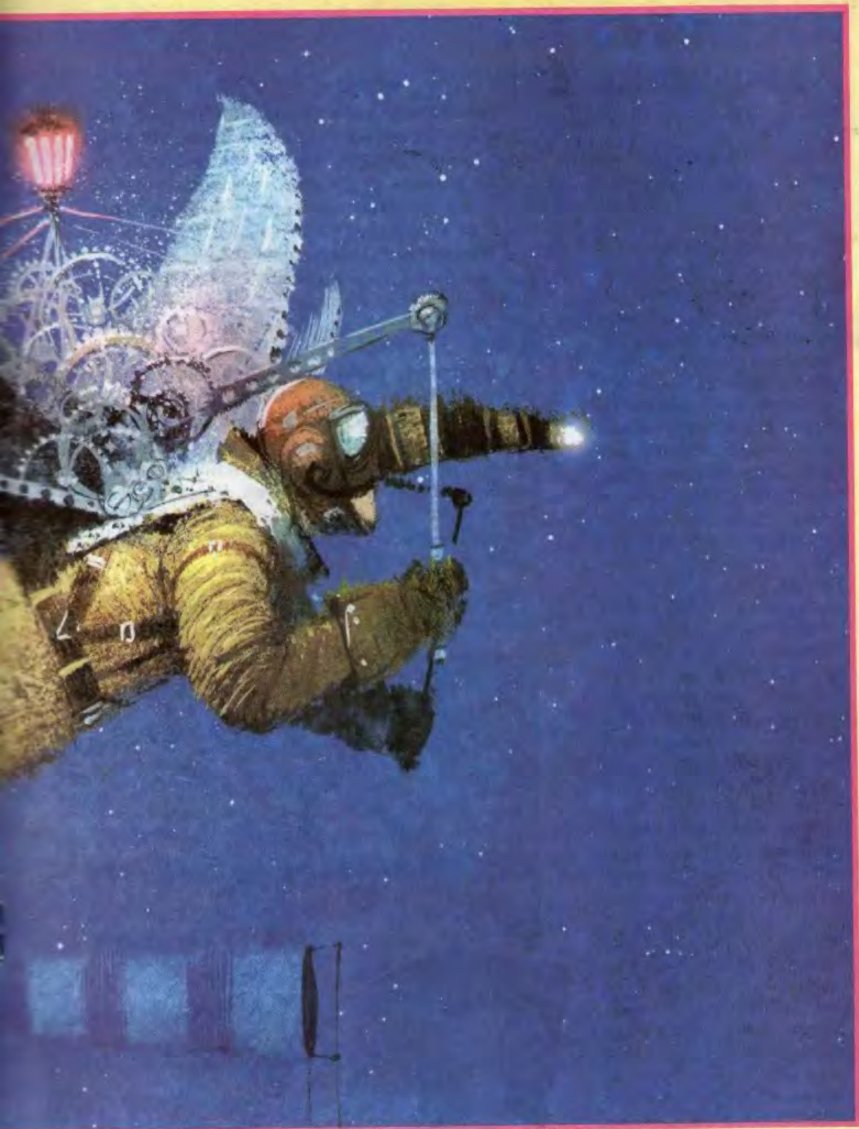
Рисунок Игоря ОЛЕЙНИКОВА