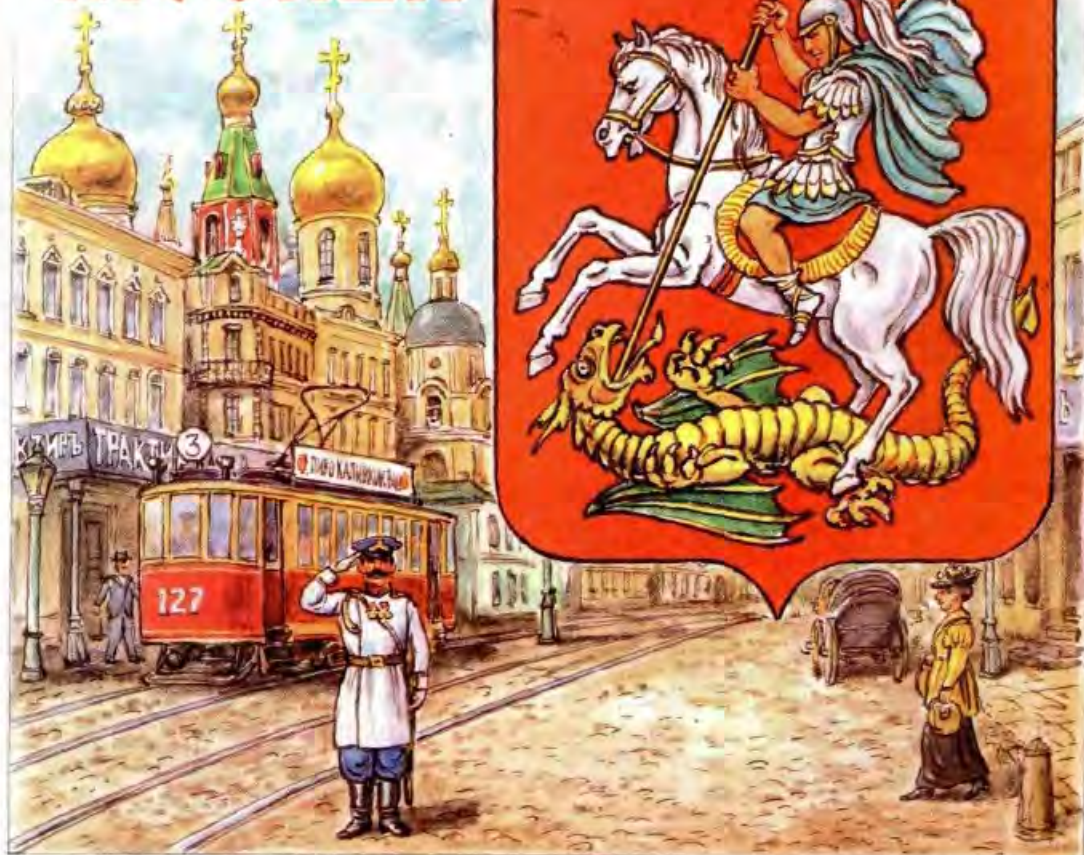
Рисунок Игоря ГОНЧАРУКА

Изображение Георгия Победоносца — очень древнее. Ещё в XV веке монеты великих князей на Руси чеканились с фигурой всадника, поражающего змея копьём и мечом. Со временем всадник попал на герб Москвы и стал символом древней столицы Московского княжества — святым Георгием Победоносцем. Этот великомученик спас от чудовища, пожиравшего юношей и девушек, целый город.