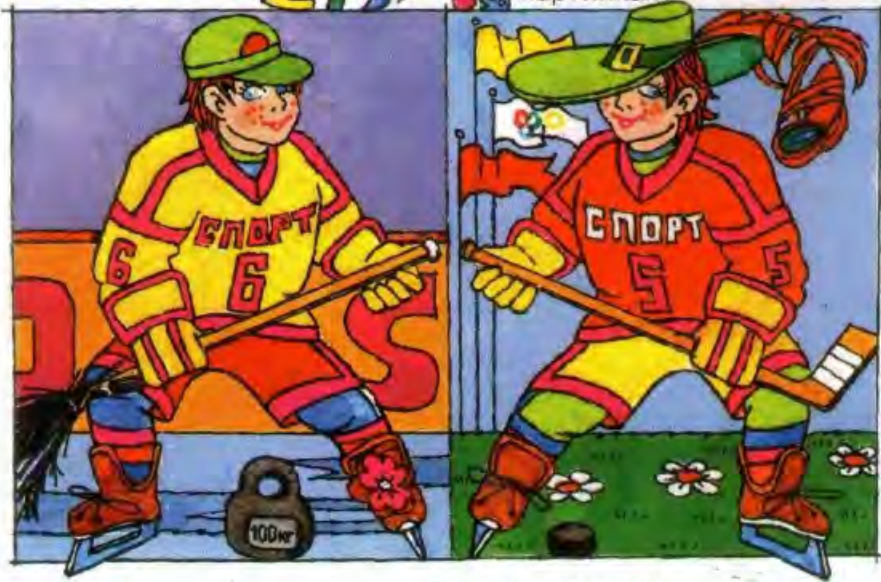
Рисунки Марины РЫДАЕВОЙ

Издание ООО «Детский иллюстрированный журнал Миша»