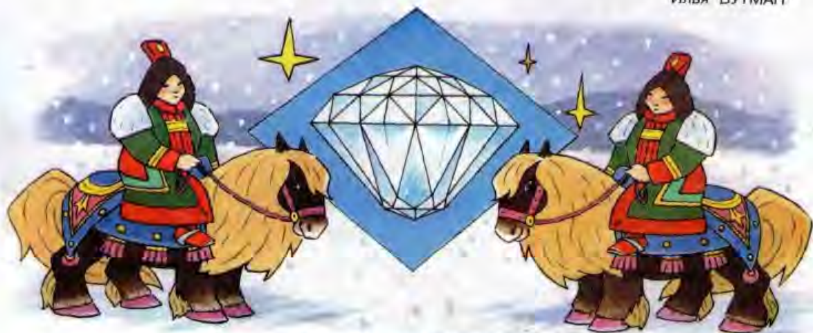
Рисунки Олега КРАМОПЕНКО