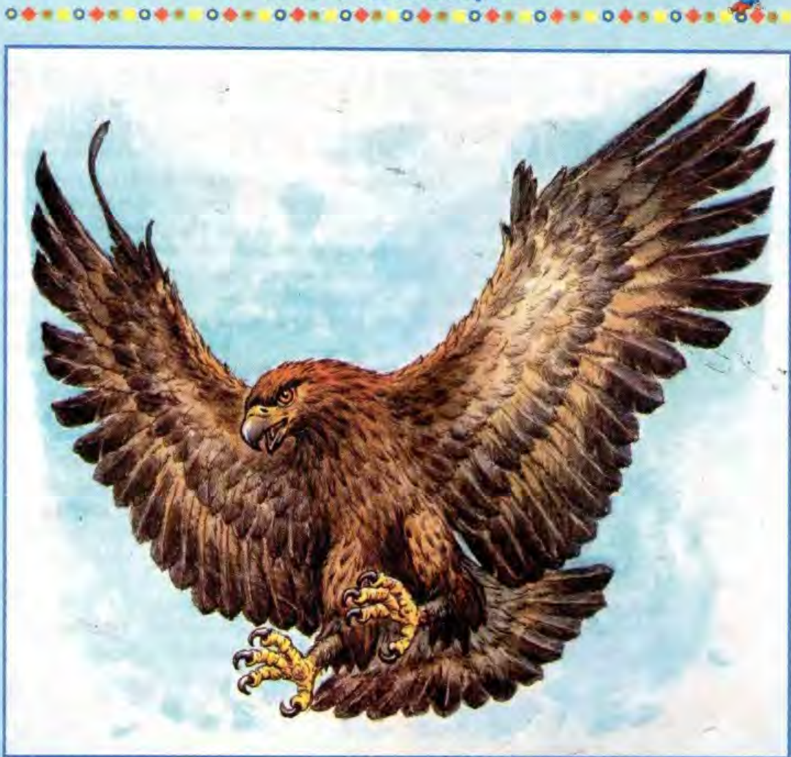
Рисунок Игоря ГОНЧАРУКА

Беркут — самый крупный орёл. Этот хищник обитает в северном полушарии Земли, и встретить его можно главным образом в горах. Больше всего от него достаётся зайцам и грызунам — именно они основная добыча беркута. Благодаря очень острому зрению такой орёл может в светлое время суток разглядеть свой будущий обед с расстояния в два километра. Поэтому люди с древности и до наших дней используют этих пернатых хищников для охоты. Интересно, что индейцы считали беркута священной птицей и во многих магических обрядах использовали его перья. В Средние века беркута изображали на различных гербах и флагах, чтобы подчеркнуть гордость и величие города или страны. Сегодня беркут — редкая птица, занесённая в Красную книгу России. Во всех странах, где он обитает, беркут находится под охраной государства.