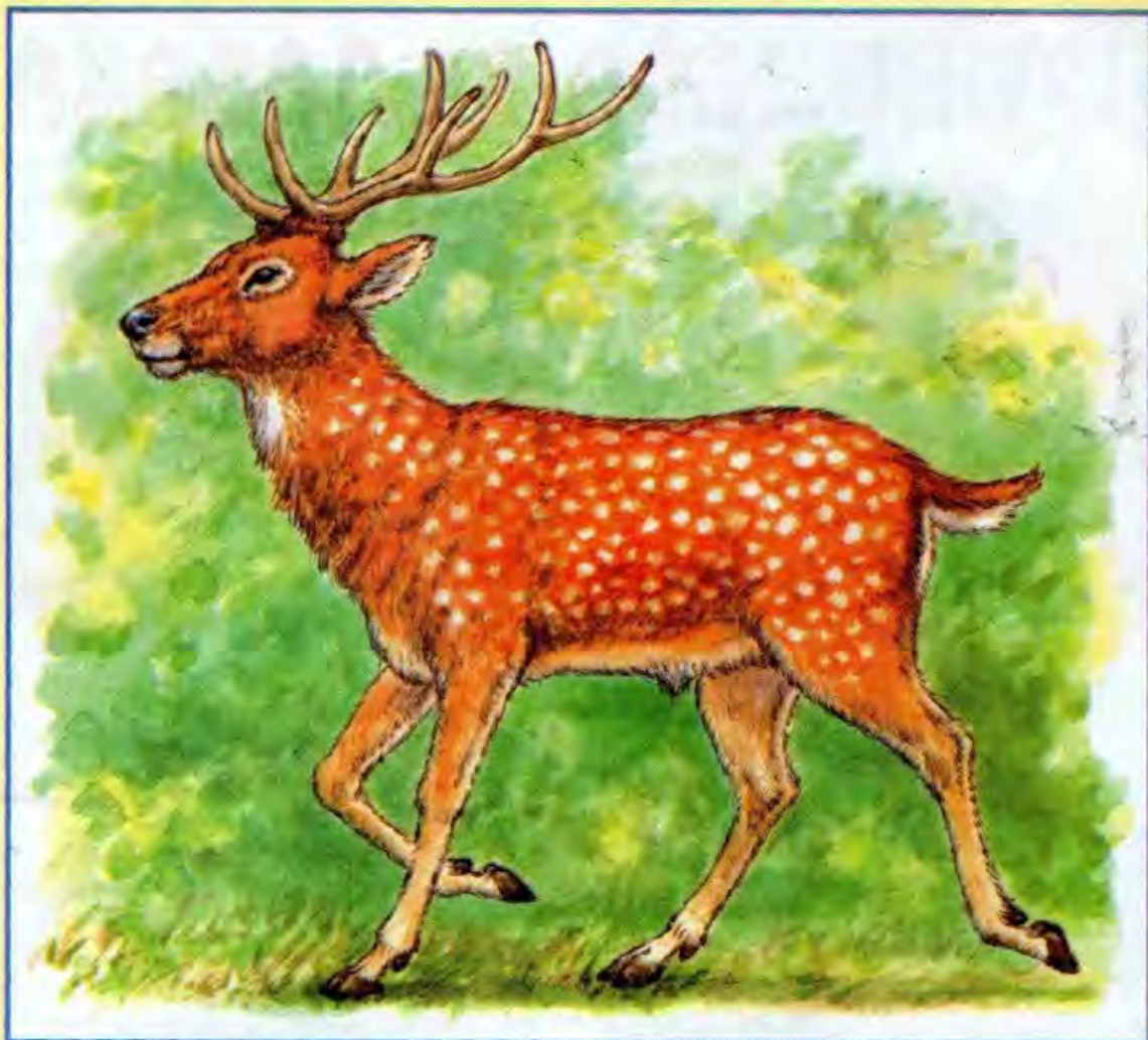
Рисунок Игоря ГОНЧАРУКА

Помните, барон Мюнхгаузен вырастил вишнёвое дерево на голове оленя? На картинке перед вами — пятнистый олень. Этот красивый зверь когда-то был широко распространён на территории Китая, Японии, Вьетнама, а сейчас сохранился только в южном Приморье в России. Пятнистые олени чаще всего встречаются в “прозрачных” лесах, которые пережили пожар. Пятнистые олени употребляют в пищу кустарники, злаки, даже водоросли. Удивительно, но эти изящные парнокопытные — прекрасные пловцы и могут преодолевать до десяти километров по морю. Из-за преследования человеком пятнистые олени едва не вымерли в начале XX века. Помимо человека главный враг оленя — волк. Если оленю посчастливится убежать от всех врагов, в природных условиях он живет до 14 лет, а в хозяйствах и заповедниках до 21 года. Сегодня охота на пятнистого оленя запрещена.