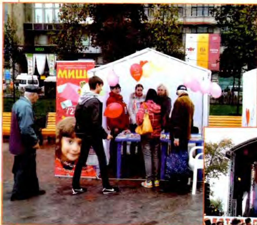
Юные читатели и их родители у павильона журнала «МИША».