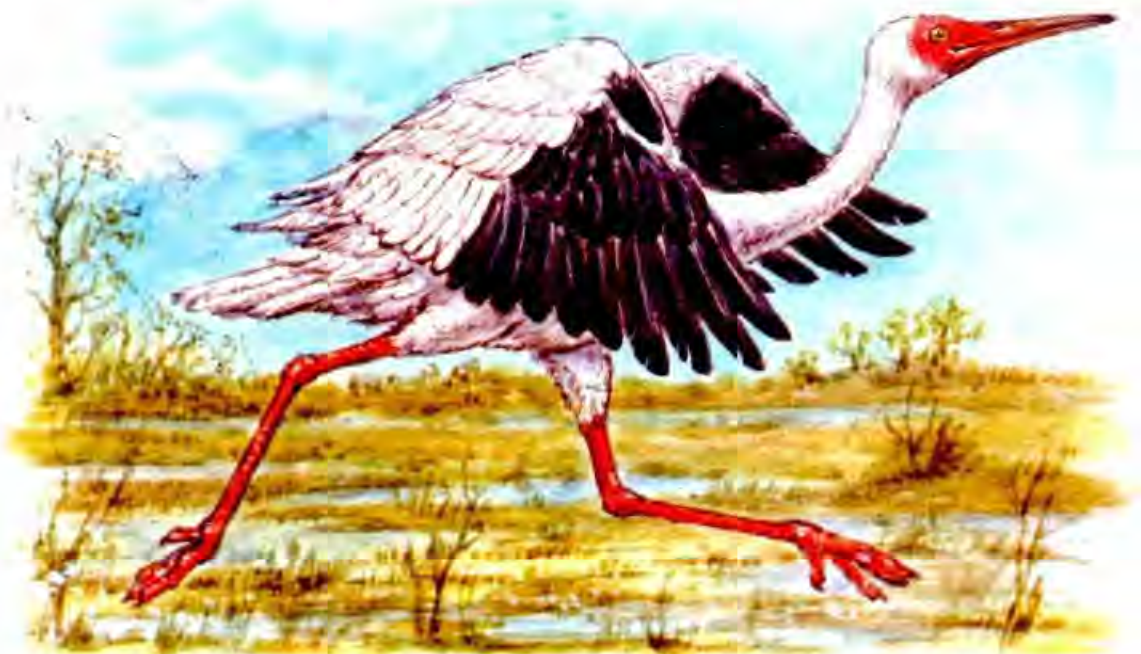
Рисунки Игоря ГОНЧАРУКА

Взрослый стерх достигает в высоту 140-160 см, а размах его крыльев около двух с половиной метров. Срок жизни стерха сопоставим с человеческим — 60-70 лет. Самка обычно откладывает два яйца, но выращивает только первенца, который насмерть заклёвывает