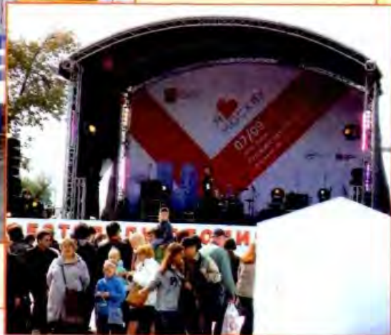
Выступление на празднике главного редактора Грозовой Нины Викторовны.