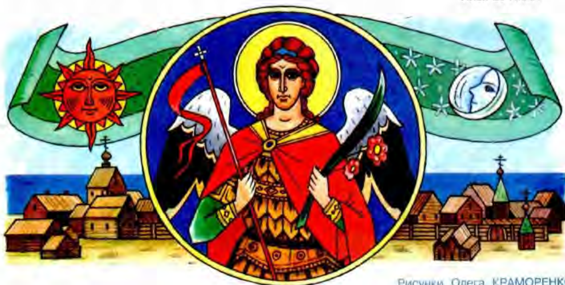
Рисунки Олега КРАМОРЕНКО