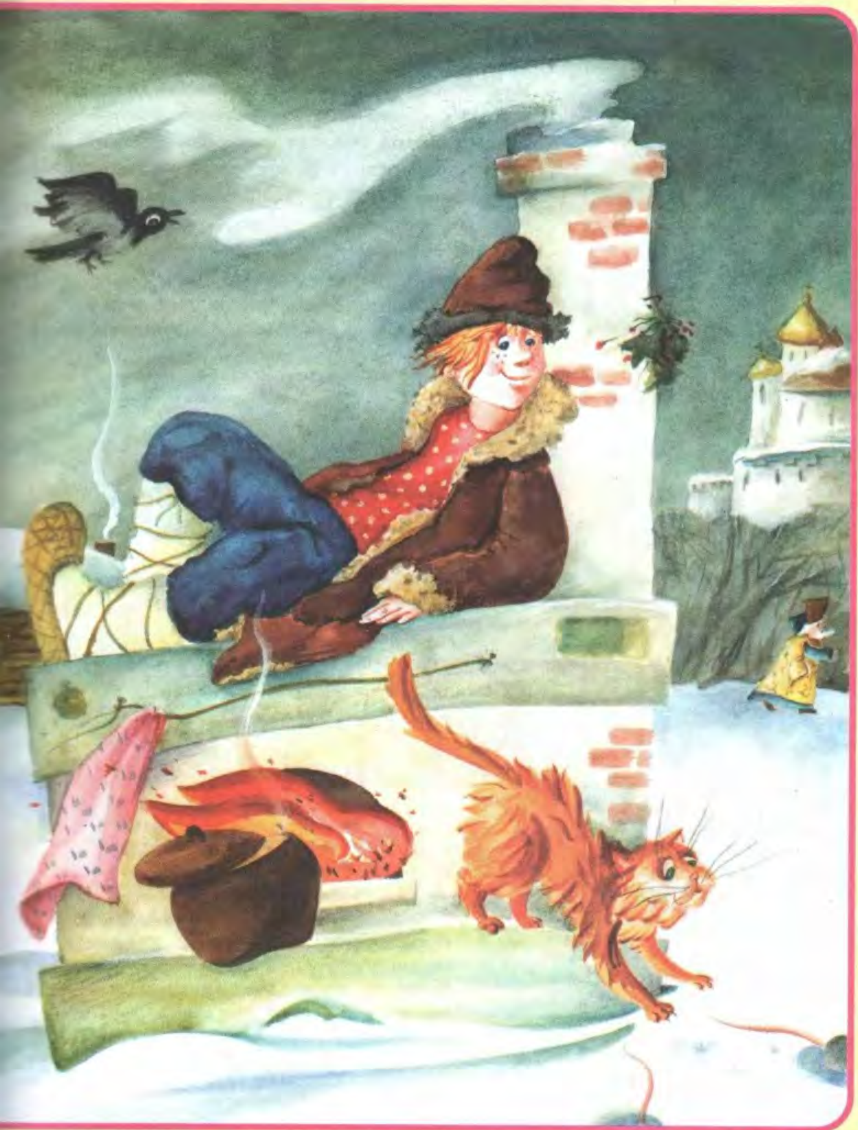
Рисунок Инны ИГНАТЬЕВОЙ