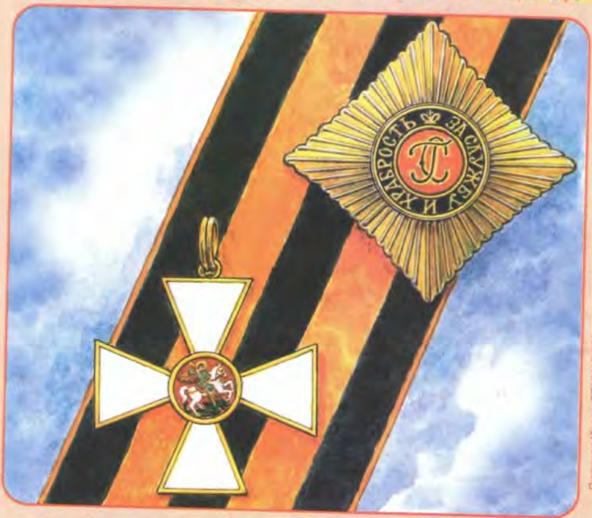
Рисунок Игоря Гончарука

По указу императора Александра I в 1807 году был учреждён знак отличия Военного ордена для нижних чинов – Георгиевский крест. Он вручался за «неустрасимую храбрость, проявленную в бою». Удостоенному такой награды солдату предписывалось носить её всегда и при любых обстоятельствах. Один и тот же человек мог неограниченное количество раз быть представлен к этой награде, однако новый крест не выдавался, лишь увеличивалось жалование военного. Лишить знака отличия можно было только по суду и с обязательным уведомлением императора.