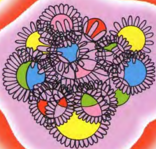
Сосчитай все цветы на картинке.