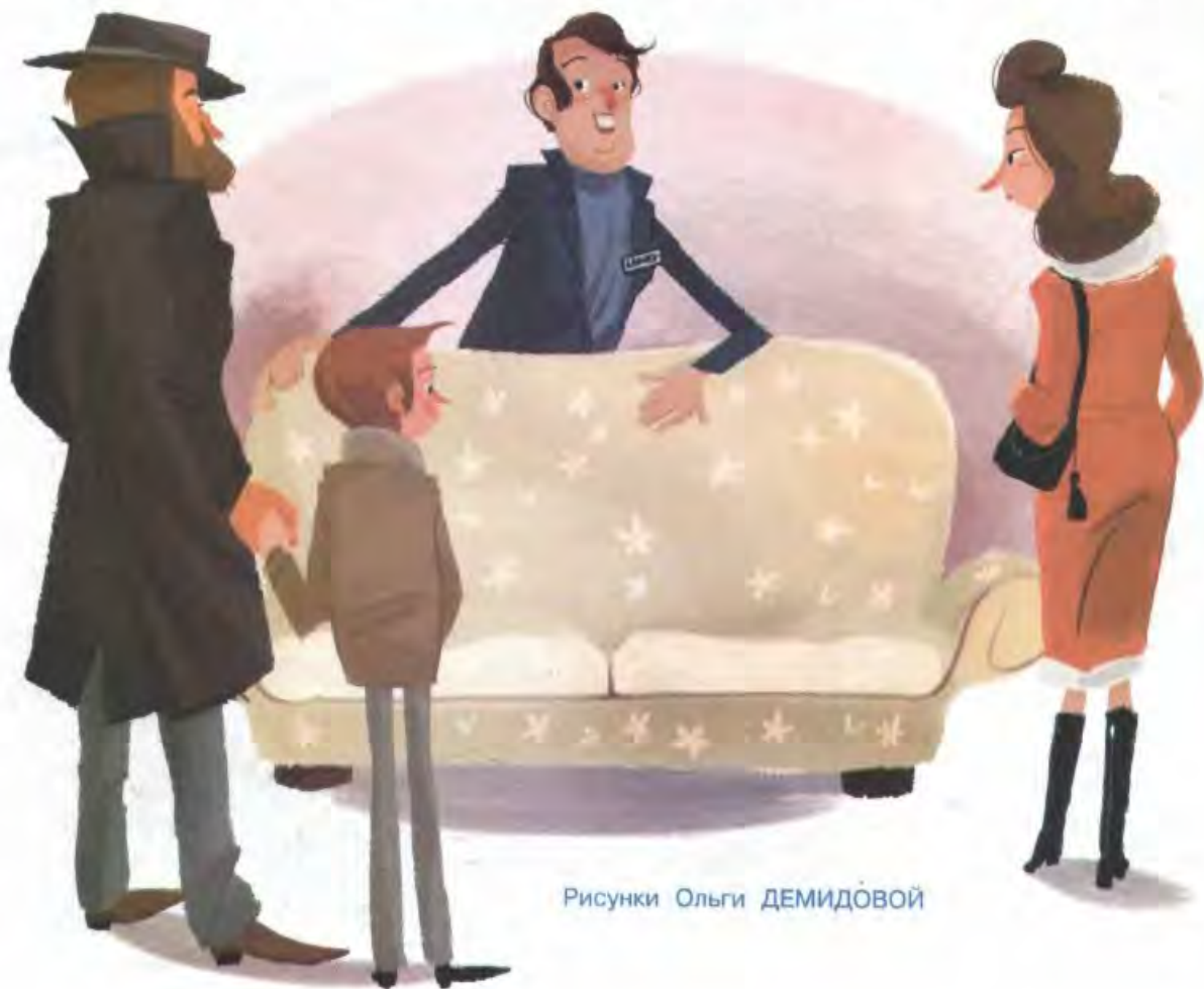
Рисунки Ольги ДЕМИДОВОЙ

К нам тут же подбежал продавец-консультант с табличкой «Ле-