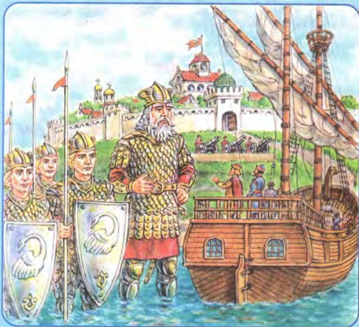
Рисунок Игоря ГОНЧАРУКА

«Сказка о царе Салтане» написана Александром Сергеевичем Пушкиным по мотивам народных сказок. Однако под пером великого поэта народное творчество засверкало новыми красками. Неудивительно, что режиссёры не раз обращались к этой пушкинской сказке в стихах.