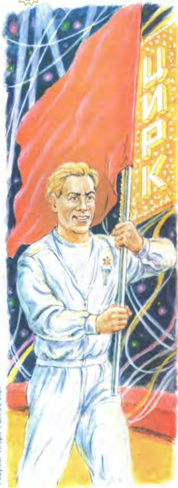
Рисунки Игоря ГОНЧАРУКА