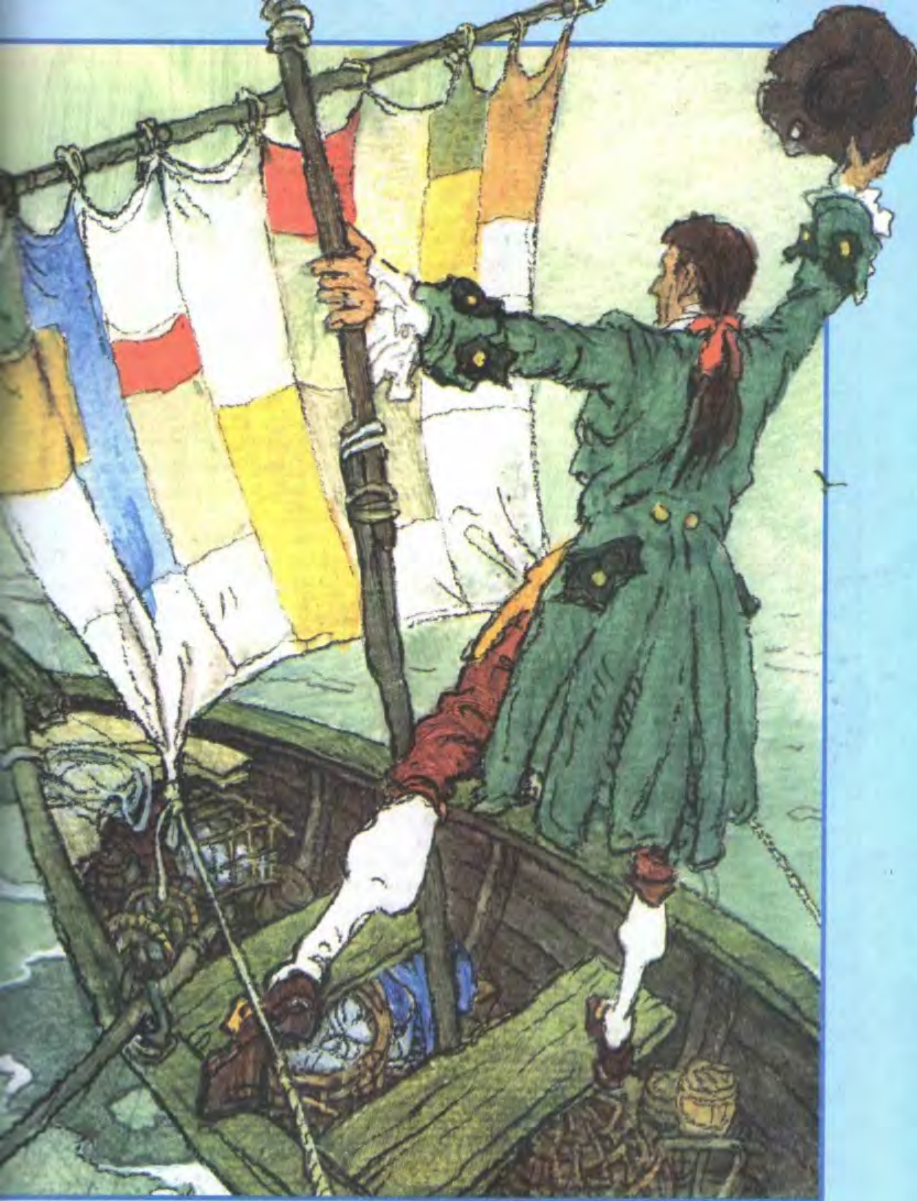
Рисунок Натальи ДЕМИДОВОЙ