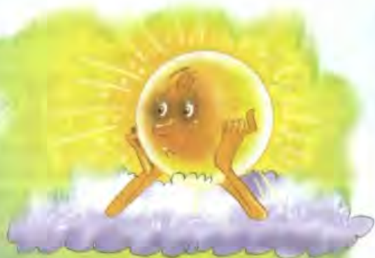
Рисунки Игоря НОВИКОВА

больше... а неболванчиков всё меньше, меньше, меньше... «А куда же неболванчики исчезали?» — спросите вы. А никуда не исчезали.