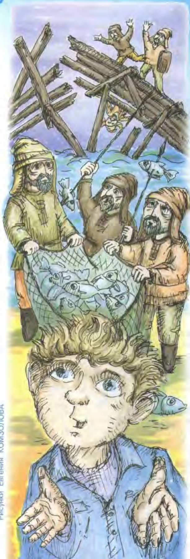
Рисунки Евгения КОМЗОЛОВА