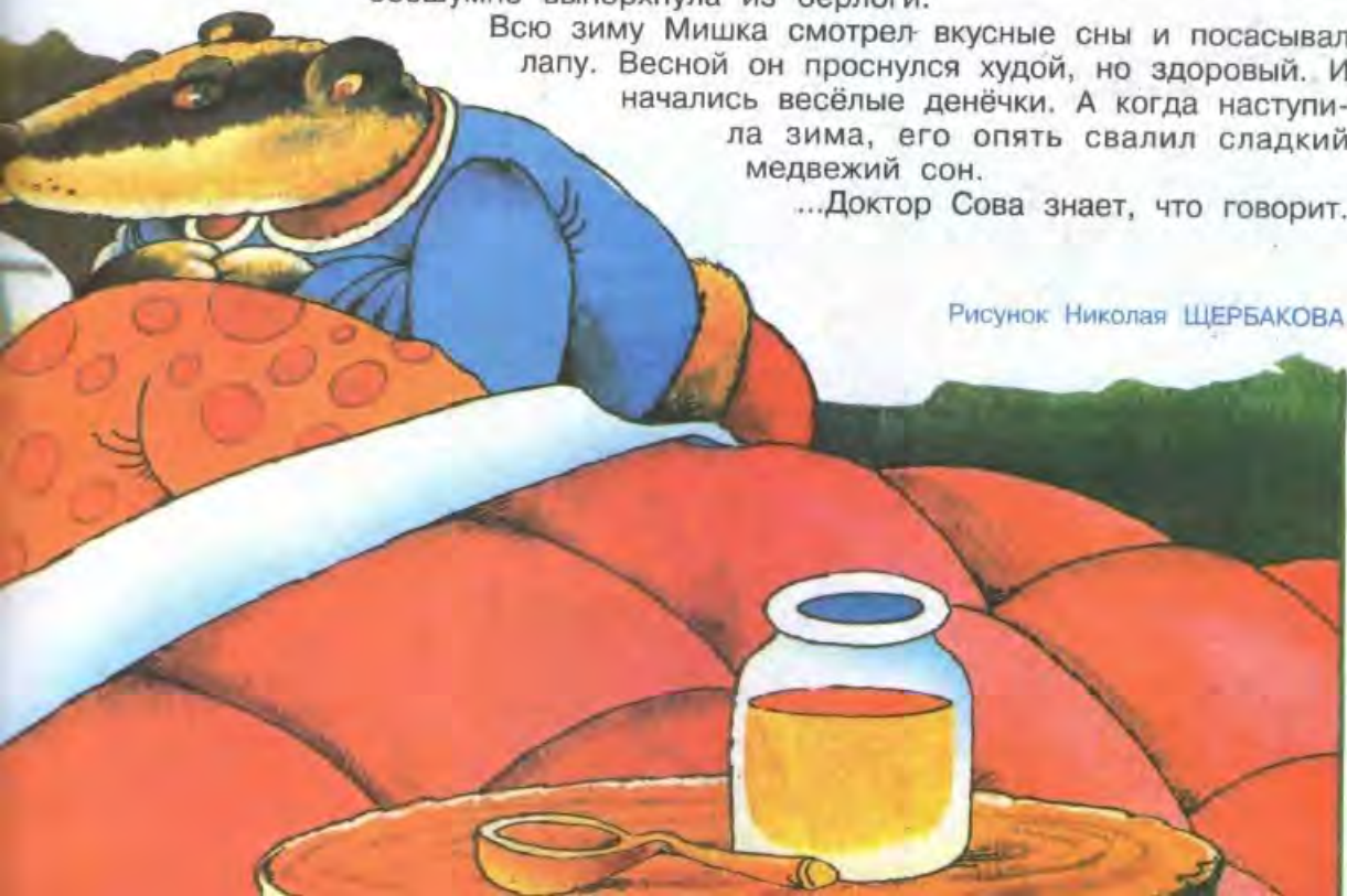
Рисунок Николая ЩЕРБАКОВА